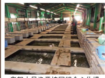
鬼怒小貝漁業協同組合ふ化場

鬼怒小貝漁業協同組合では、鬼怒川に遡上した鮭から約60万粒を採卵して人工ふ化を行っています。産業の発展に伴い、鮭が自然繁殖できる環境が少なくなったため、人の手で卵から稚魚になるまでお手伝いをしています。大切に育てられた稚魚は、鬼怒川や勤行川に放流され、数年後ふるさとの川に戻ってきます。