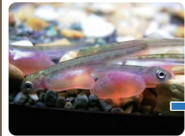
ふ化したばかりの稚魚