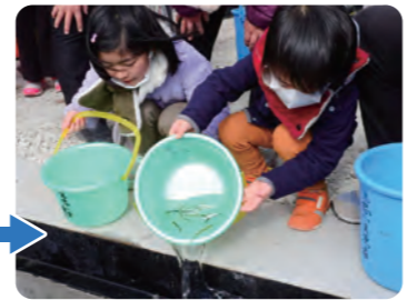
稚魚放流会(2月)大海原へ向け出発!