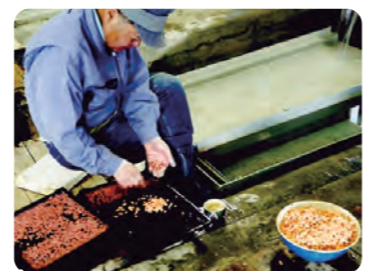
卵を選別している様子