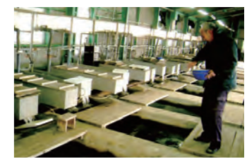
鬼怒小貝漁業協同組合ふ化場

産業の発展に伴い鮭が自然繁殖できる環境が少なくなったため、人の手で卵をふ化し、元気な稚魚になるまで育ててから川に放流しています。 鬼怒小貝漁業組合では、鬼怒川に遡上した鮭から約60万粒を採卵して人工ふ化を行っています。大切に育てられた稚魚は、鬼怒川や勤行川に放流され、数年後ふるさとの川に戻ってきます。