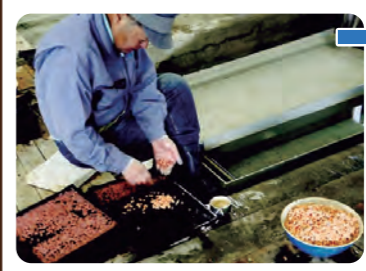
卵を選別している様子