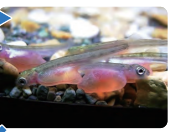
ふ化したばかりの稚魚