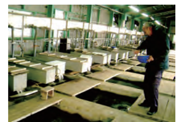
鬼怒小貝漁業協同組合ふ化場

産業の発展に伴い鮭が自然繁殖できる環境が少なくなったため、人の手で卵をふ化し、元気な稚魚になるまで育ててから川に放流しています。 鬼怒小貝漁業組合では、鬼怒川に遡上した鮭から約60万粒を採卵して人工ふ化を行っています。大切に育てられた稚魚は、鬼怒川や勤行川に放流され、数年後ふるさとの川に戻ってきます。