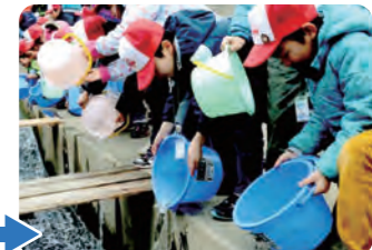
稚魚放流会 大海原へ向け出発！