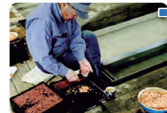
卵をふ化させる様子