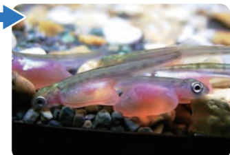
ふ化したばかりの稚魚