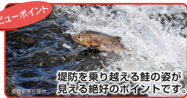
堤防を乗り越える鮭の姿が見える絶好のポイントです。