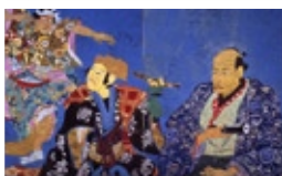
片岡球子作「面構 烏亭焉馬と二代團十郎」

会期中の入館料 一般 500円・団体 400円 高校生以下無料※板谷波山記念館も観覧可能