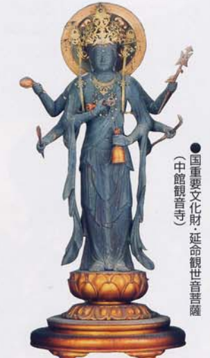
●国重要文化財 延命観世音菩薩 (中館観音寺)