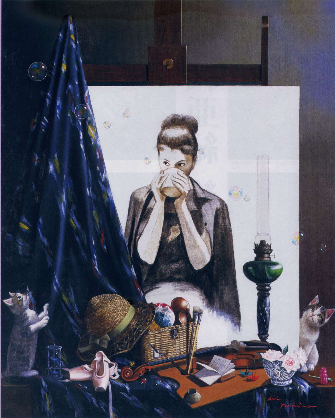
「やすらぎ」ル・サロン展入選 2002年制作